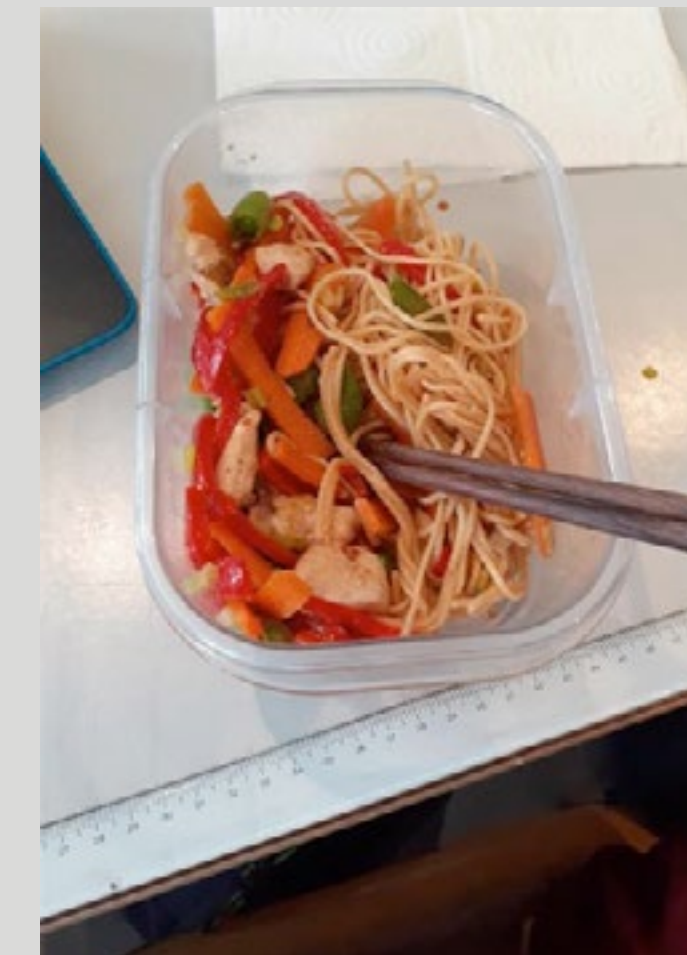
Nudler er en god måde på at få en anderledes slags mad. Kyllingen er en af de bedre kødmuligheder. Grøntsager er også godt for miljøet. Der er også soyaovs i nudlerne, hvilket er dårligt for miljøet, fordi det skal fragtes helt fra Asien.