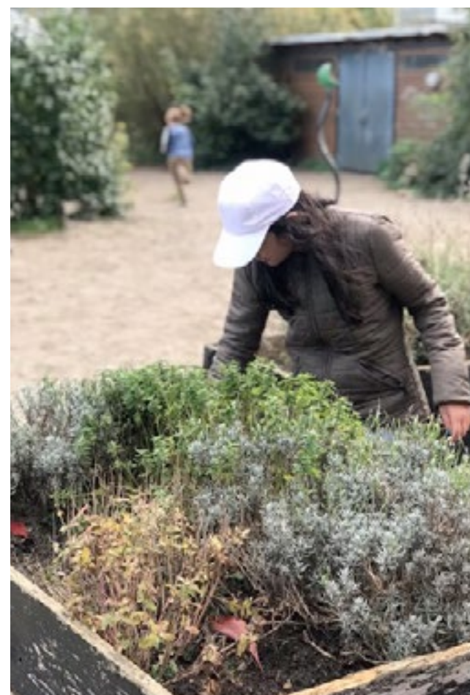
Vi passer rigtig godt på vores planter her på Kildevældsskolen.