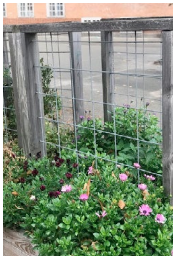
Her kan I se vores nye blomster, og dem har vi masser af her på Kildevældsskolen. Og det er en ting mange her på Kildevældsskolen, måske ikke rigtig lægger mærke til.

»Jeg tænker over, hvor meget kød jeg spiser, og især hvor meget oksekød jeg spiser, og jeg cykler på arbejde