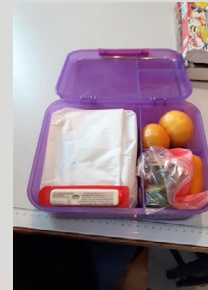
Klementiner er sunde, men det er ikke godt for miljøet at flyve dem til Danmark. Agurkerne er derimod bedre for miljøet, siden de gror i Danmark. Ostehapsen kunne godt skiftes ud med for eksempel en figenstang. Spinatpizzaen er en god vegetarisk valgmulighed, men man skal ikke have det hver dag.