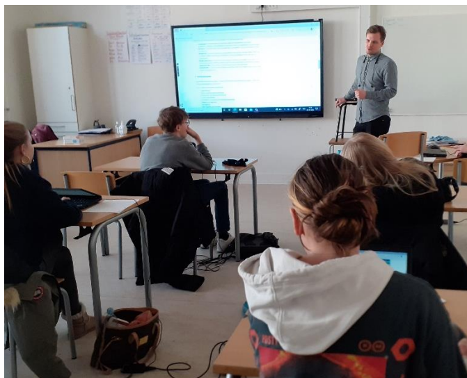
Bygningskonstruktør fra E&P fortæller om sin uddannelse og sit job

Et af 9 klasses valgfag hedder "Udsyn - uddan-nelse og job". I forbindelse med valgfaget og karrierelæring, har byggeleder og bygnings-konstruktør fra E&P, været på besøg i klassen. Klassen havde inden besøget læst om uddan-nelsen og jobbet og havde forberedt spørgs-mål.