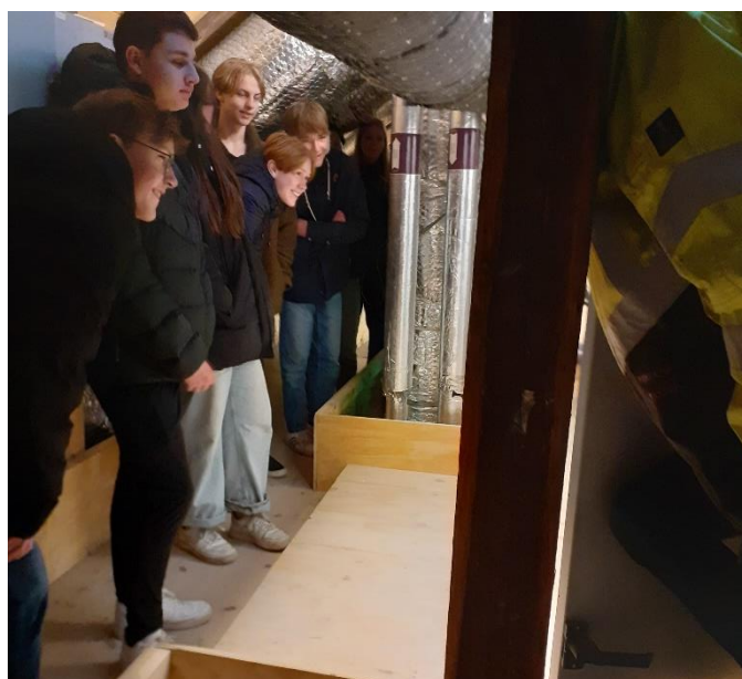
Besigtigelse af ventilationsanlæg der er placeret øverst under taget.

Da elever fra 9 klasse skulle i erhvervspraktik, var 2 elever i praktik som tømrer, VVS'er og elek-triker hos Enemærke og Petersen. De var bl.a. med i det nye Kulturhus hvor de fulgte byggesa-gens håndværkere.