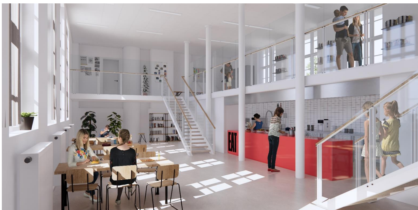
Illustration af det kommende EAT-område.