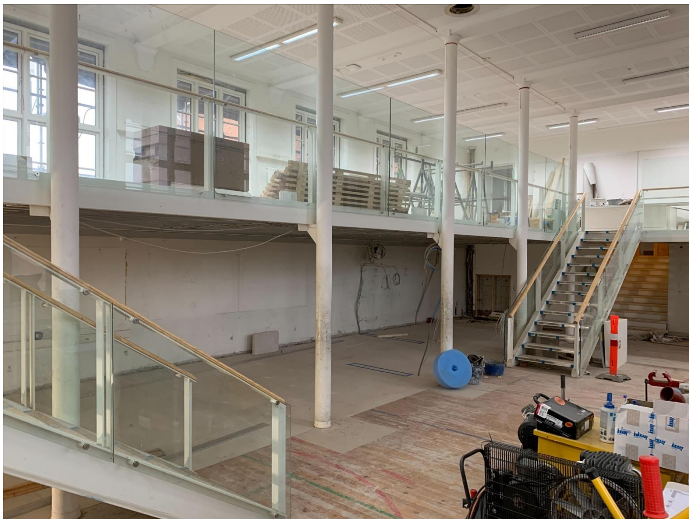
Igangværende byggearbejder i det kommende EAT-område.