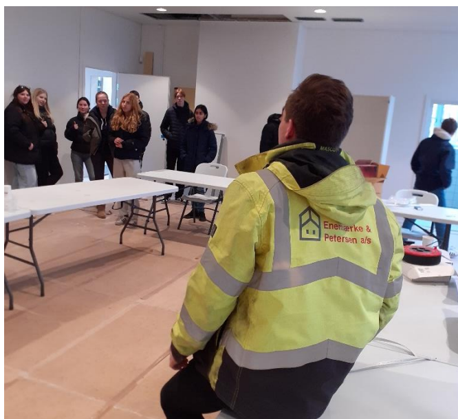
Rundvisning og besøg på Kildevældskolens byggeri.